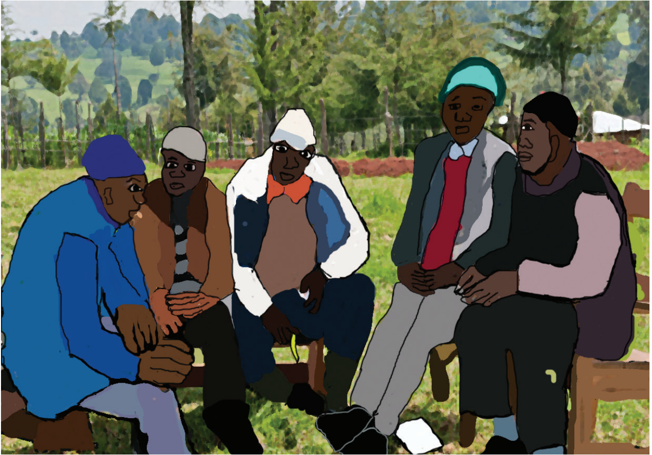
FATIN ATU TAU KARIMBU ONG SIRA-NIAN